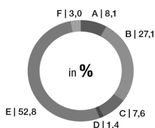
Stadtwerke Augsburg Energie GmbH* Standardprodukte

Radioaktiver Abfall: 0,0002 g/kWh CO 2 -Emissionen: 302 g/kWh