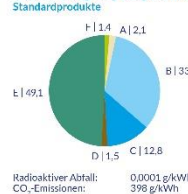
Stadtwerke Augsburg Energie GmbH Standardprodukte