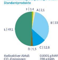
Stadtwerke Augsburg Energie GmbH Standardprodukte