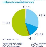
Stadtwerke Augsburg Energie GmbH Unternehmenseinkaufsmix