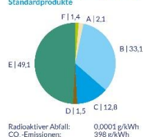
Stadtwerke Augsburg Energie GmbH Standardprodukte