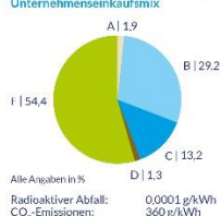
Stadtwerke Augsburg Energie GmbH Unternehmenseinkaufsmix