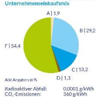
Stadtwerke Augsburg Energie GmbH Unternehmenseinkaufsmix