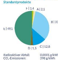
Stadtwerke Augsburg Energie GmbH Standardprodukte