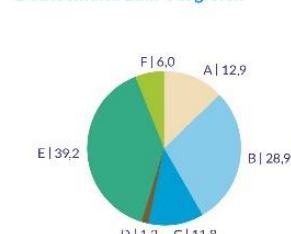
Deutschland zum Vergleich

Radioaktiver Abfall: 0,0003 g/kWh CO 2 -Emissionen: 350 g/kWh